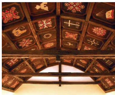
Die geschmückte Decke der evangelischen Kirche in Mátyásföld