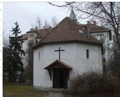
So sieht jetzt die neue Kirche aus

Der Grundriss der neuen Kirche ist achteckig, was im rechteckigen Innenraum nur im Altarraum wahrzunehmen ist. Der einstige Turm mit den vier kleinen Türmchen wurde nicht mehr wieder errichtet. Das Dach wurde mit Ziegeln gedeckt, in der Mitte steht ein kleiner Turm. Die zwei Seitenmauern werden durch je drei langen Fenster, die beiden anderen durch vier Lisenen gegliedert. Um das aus Eichenholz angefertigte Tor mit den Kassetten zu schützen, wurde ein Vordach gebaut, darüber auf der Mauer ist ein Holzkreuz angebracht. Die Länge der jetzigen Kirche ist im Vergleich zu der ursprünglichen Kirche um 4 m kürzer, deshalb sind einige Reihen der Kassetten der Decke nicht mehr auf ihren eigentlichen Platz zurückgebaut worden. (Man hat einige Elemente von denen weggelassen, die sowieso mehrmals vorgekommen sind.)