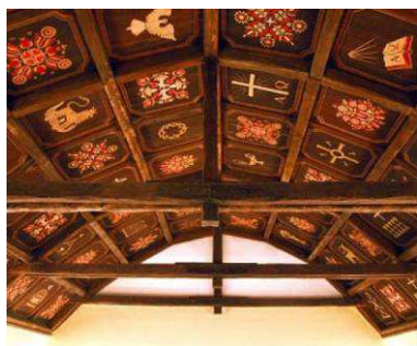
A mátyásföldi evangélikus templom díszes mennyezetet

Megközelíthető a 45. vagy 46. autóbussszal.