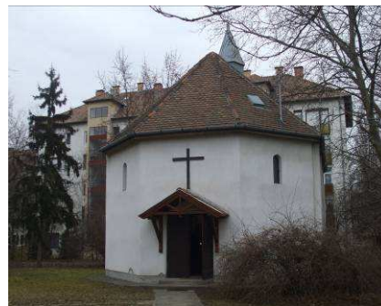
Az új templom megjelenése napjainkban

Az új templom alaprajza nyolcszögletű, de ez téglalapalakú belsejében csak az oltártérben érzékelhető. A régi torony négy fiatornyával nem épült fel. A tetőt cserepekkel, közepén lévő kis huszártornyát horganylemezzel borították. Két oldalfalát 3-3 hosszú ablak, a másik kettőt négy lizéna ( pillért utánczó vakolatsáv ) tagolja. Kazettás betétű tölgyfakapuja védelmére előtető készült, fölötté fakeszt. Hossza — az eredeti templomhoz képest — 4 méterrel rövidebb, ezért a mennyezet néhány sor kazettája nem került a helyére (a többször is előforduló elemekből hagytak el).